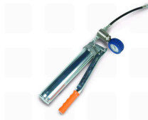
KÖSTER Manuel Enjeksiyon Presi

Uygulama sırasında katı veya sıvı madde tüketmeyiniz, buharını teneffüs etmeyiniz. Koruyucu eldiven, gözlük ve elbise kullanınız. Göz ve deri temasından kaçınınız. Deri teması halinde bol su ve sabun ile yıkayınız. Göz teması halinde bol su ile yıkayınız ve hemen bir doktora başvurunuz. Çocukların ulaşamayacağı yerde saklayınız. Yutmayınız, boş ambalajları gıda maddesi ve içme suyu depolamak amacı ile kullanmayınız.